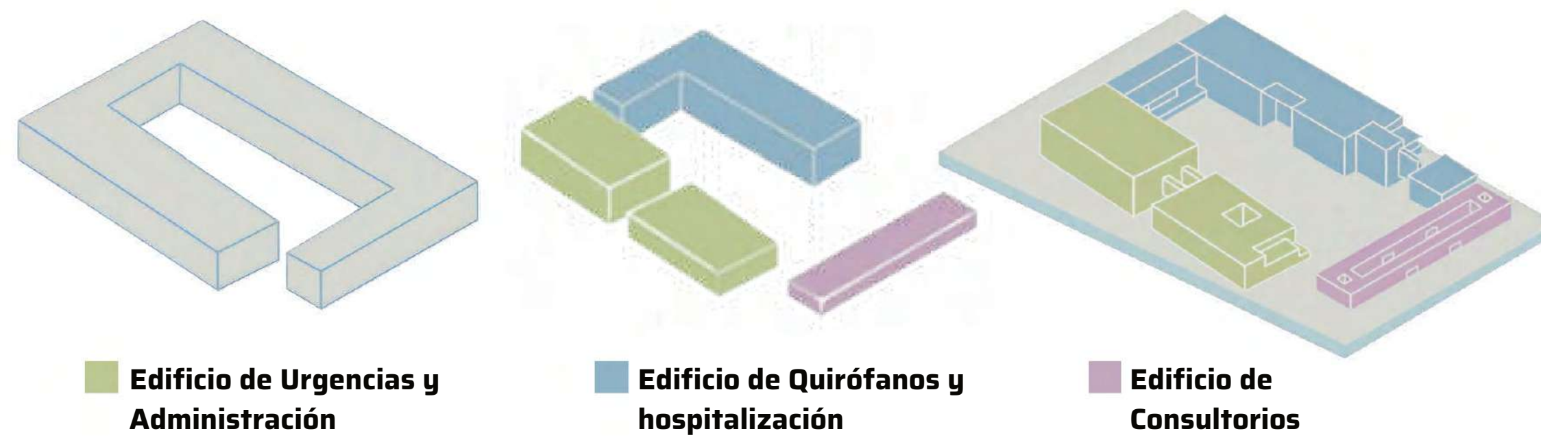
Diagrama de forma

El uso de plantas acuáticas como biofiltros es una estrategia natural y sostenible para mantener la salud del lago.