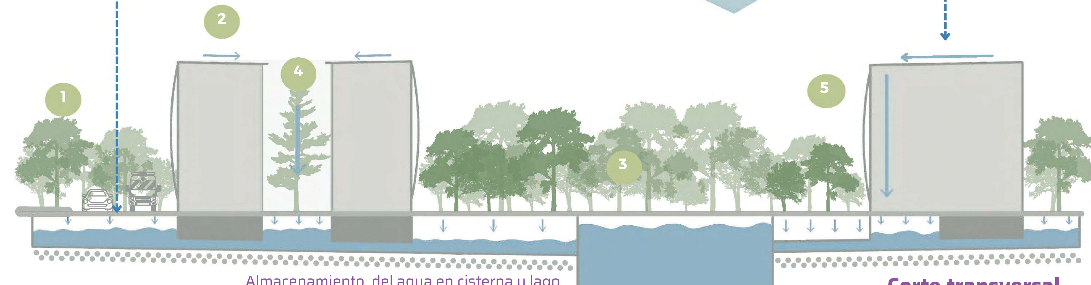
Almacenamiento del agua en cisterna y lago