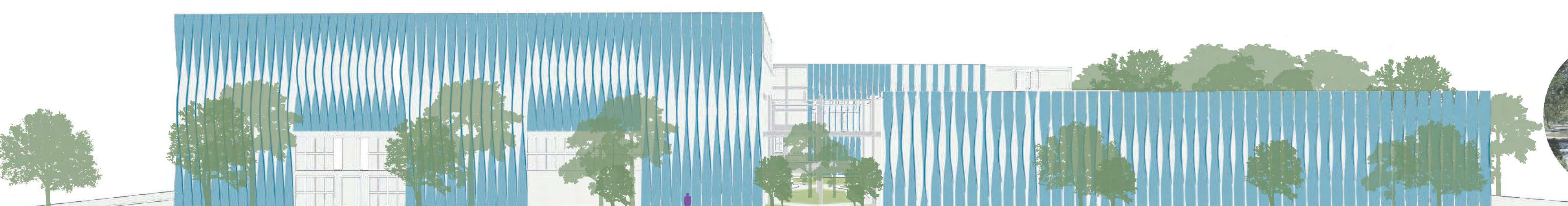
Corte por fachada