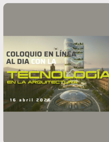
Coloquio en línea