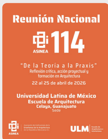
Reunión Nacional 114

En 2026 continuamos fortaleciendo la agenda académica de ASINEA con la 114ª Reunión Nacional , el ENEA 37 , el 7mo Concurso de Carteles , el coloquio en línea renovado con un nuevo nombre: Al día con... , y nuevos viajes de estudio , iniciando en enero con destino a Chicago . Además, ampliaremos nuestra presencia en medios digitales con la apertura del canal institucional de ASINEA en LinkedIn , fortaleciendo la vinculación académica y profesional. Te invitamos a apartar las fechas y a seguir participando en las convocatorias y actividades que seguiremos impulsando juntos.